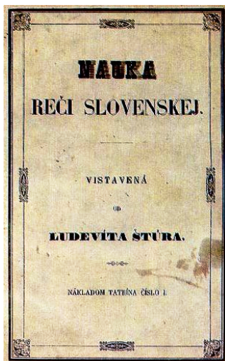
Nauka reči Slovenskej

Roku 1846 - Ľudovít Štúr publikoval literárne dielo Nauka reči Slovenskej (Náuka reči slovenskej) , ktorým položil základy spisovného jazyka po gramatickej stránke.