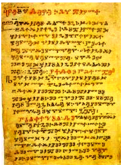
Ukážka hlaholiky (Kyjevské listy)

Roku 863 n. l. - prišli z Byzancie na Veľkú Moravu na pozvanie panovníka Rastislava bratia Konštantín a Metod . Priniesli so sebou náboženské knihy preložené z gréčtiny do staroslovienčiny, napísané v hlaholike - najstaršom slovanskom písme. Hlaholiku zostavil Konštantín na základe malých gréckych písmen a s použitím písmen niektorých orientálnych národov. Názov hlaholika bol odvodený od staroslovanského slova glagol - hlahol [1] .