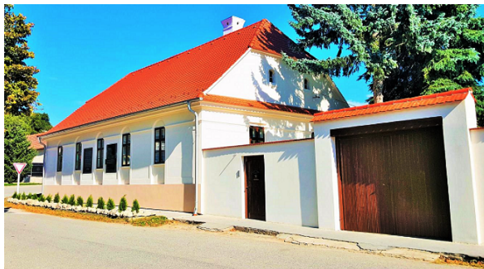
Fara v Hlbokom dnes

Roku 1844 - slovenčina Ľudovíta Štúra bola vyhlásená za spisovný jazyk.