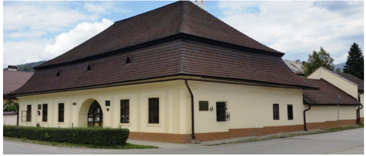
Budova prvého slovenského gymnázia v Revúcej

Roku 1863 - bola založená Matica slovenská .