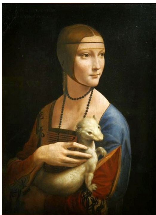
Dáma s hranostajom, Krakov, Múzeum Czartoryskich. Obraz má za sebou pohnutý osud a často menil svojho majiteľa.

„Rok 1452. V sobotu dňa 15. apríla o tretej v noci narodil sa mi vnuk, syn sera Piera, môjho syna. Dostal meno Leonardo.“ Tieto slová do rodinnej kroniky zapísal notár ser Antonio da Vinci, Leonardov starý otec. Matkou nemanželského dieťaťa bola Caterina, vidiecke dievča. Dieťa pokrstili na Bielu nedeľu v kostolíku Svätého kríža vo Vinci, čím mu zabezpečili zákonný vstup do života. Rodinné záležitosti spojené s Leonardom dal ser Antonio do poriadku. Syna oženil s mladou Florentankou Albierou a podplatil mladíka Accattabriga, aby si vzal Caterinu za ženu. O Leonardovom detstve sa vie len málo. Vyrastal v dome svojho starého otca, v bezprostrednom kontakte s prírodou. Možno práve tu môžeme nájsť korene jeho neutíchajúceho záujmu o prírodné vedy. Okolo roku 1460 sa jeho otec Pier rozhodol presťahovať so synom do neďalekej Florencie, kde mu zabezpečil vzdelanie. Florencia bola v 15. storočí jedným z najbohatších miest Talianska. Pod vládou Mediciovcov tu rozkvitali remeslá i umenie. V ich paláci sa schádzali literáti a filozofi, aby študovali, prekladali a rozoberali spisy antických autorov – Platóna, Aristotela, Vitruvia. Všetci umelci, čo vytvárali lesk tohto storočia, žili a pracovali tu: Donatello, Brunelleschi, Lippi, Luca della Robbia, Michelozzo, Minoda Fiesole, Luca Signorelli. V takejto klíme sa formovala osobnosť Leonarda da Vinciho.