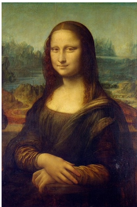
Slávna Mona Lisa v parížskom Louvri. Obraz si jeho autor mimoriadne obľúbil a nosil ho dlhé roky so sebou. Predal ho až francúzskemu kráľovi Františkovi I.