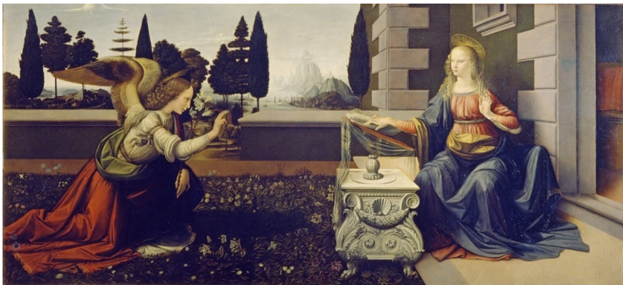
Zvestovanie , malba na dreve. Galleria degli Uffizi vo Florencii. Jedno z raných umelcových diel.

Zachovaných malieb je veľmi málo, veľa prác zostalo nedokončených. Jeho sochy a architektonické projekty neboli nikdy realizované. Niektoré jeho technické vynálezy ďaleko predbehli svoju dobu, ťažko však posúdiť, do akej miery by sa dali zrealizovať za vtedajších možností. Napriek tomu, či možno práve preto, jeho tvorba viedla k najrozličnejším interpretáciám a jej jednotlivé oblasti sú do dnešného dňa zdrojom inšpirácie pre výskum.