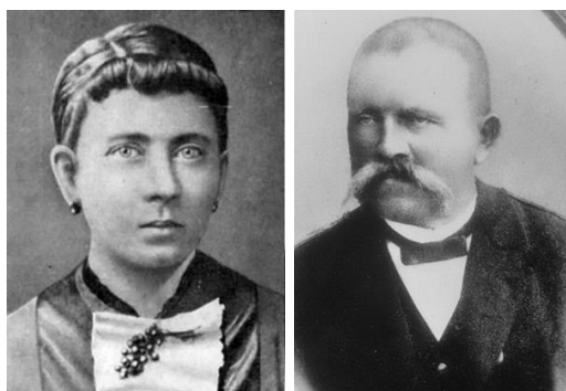
Rodičia Adolfa Hitlera

Adolf Hitler sa narodil 20. apríla 1889 v Brannau am Inn v Rakúsko-Uhorsku. Bol synom rakúskeho colníka Aloisa Schickelgrubera Hitlera a jeho tretej ženy Kláry, ktorá pochádzala z dedinského prostredia.