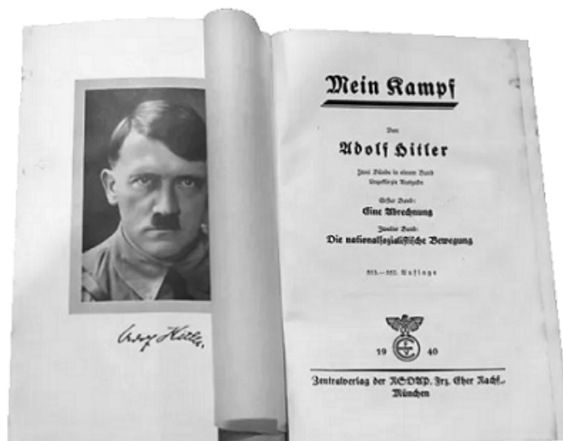
Hitlerov Môj boj z roku 1940

obklopoval sa jedine bavorskými kultúrnymi zvykmi.