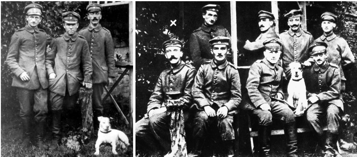
Hitler ako vojak nemeckej armády

V roku 1912 sa presťahoval do Mníchova, kde ho zastihla Prvá svetová vojna . Bol ňou radostne prekvapený a vzrušený. Odmietol narukovať k rakúsko-uhorskej armáde a v zapätí ho prijali k bavorskému pešiakovému pluku a slúžil v prednej línii ako spojka.