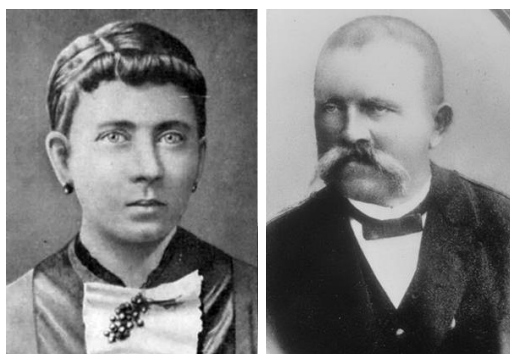
Rodičia Adolfa Hitlera