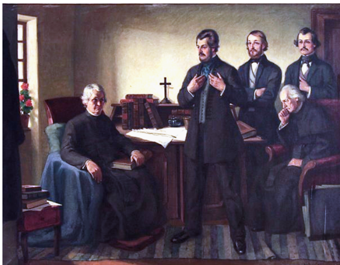
Na fare v Hlbokom

- 11.-16. 7. - na fare v Hlbokom prerokovali Ľudovít Štúr (1815-1856) , Michal Miloslav Hodža (1811-1870) a Jozef Miloslav Hurban (1817-1888) pravidlá kodifikácie novej spisovnej slovenčiny. V tejto fare, ktorá patrí medzi najvýznamnejšie miesta slovenského národa, žil Jozef Miloslav Hurban (od roku 1843 až do svojej smrti) a je rodným domovom Svetozára Hurbana Vajanského (1847-1916),