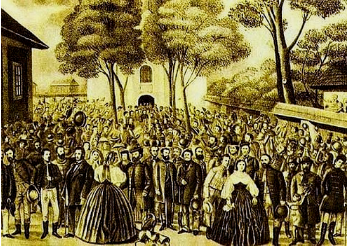
Prijatie Memoranda slovenského národa