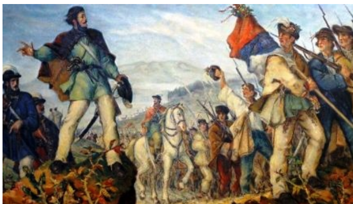
Slovenskí dobrovoľníci vstupujú na povstalecké územie

Roku 1848, 3. 12. - slovenskí dobrovoľníci zložili prísahu vernosti cisárovi a slovenskému národu. Pod velením podplukovníka Frischeisena „zimná výprava“ prenikla cez Strenčiansku úžinu na Kysuce, odtiaľ do Turca a obsadzovala postupne široké pásmo stredného a východného Slovenska. Druhá skupina vnikla na juhozápadné Slovensko. Aj keď ich počet postupne prevýšil 2 000 mužov, široké masy obyvateľstva zaujali skôr vyčkávacie stanovisko.