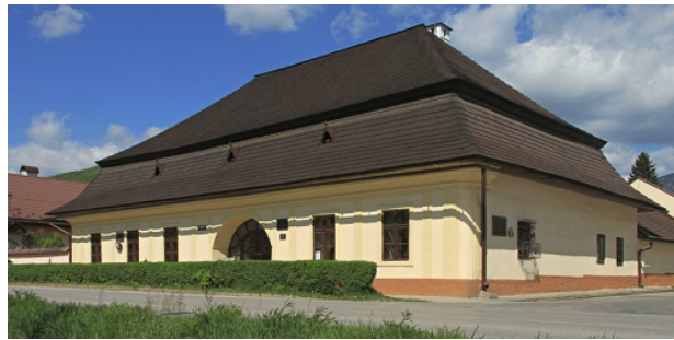
Budova prvého slovenského gymnázia v Revúcej

Roku 1863 - prebehlo zakladajúce valné zhromaždenie Matice slovenskej v Martine.