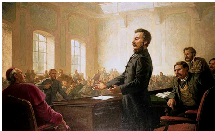
Vystúpenie Štúra na uhorskom sneme

Roku 1847, 30. 10. - Ľudovít Štúr bol vyslaný mestom Zvolen za poslanca do uhorského snemu. Hneď po svojom zvolení predložil snemu petíciu Slovákov za zrušenie zákonov, ktoré násilne zavádzali maďarčinu nielen v úradoch, ale aj na školách a v kostoloch. Svoje reči predniesol na sneme 17. novembra a 21. decembra. Bránil záujmy slovenského národa proti legálnej maďarizácii. Vyhlásil, že najlepší liek proti revolúcii je sloboda.