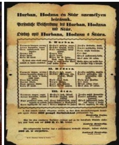
Zatykač na Hurbana, Hodžu a Štúra

Roku 1848, 2. 6. - v Prahe sa konal Slovanský zjazd. Slovenskí predstavitelia sa na ňom zúčastnili pod vedením Štúra, Hodžu a Hurbana. Štúr kritizoval austroslavistické postoje českých liberálov a všetci slovenskí rečníci protestovali proti maďarizačnému nátlaku v Uhorsku. Slováci predložili spoločné žiadosti s Rusínmi a nakoniec sa dohodli s Chorvátmi o spoločnom postupe aj vo vojenských podujatiach na vydobytie svojich národnostných práv.