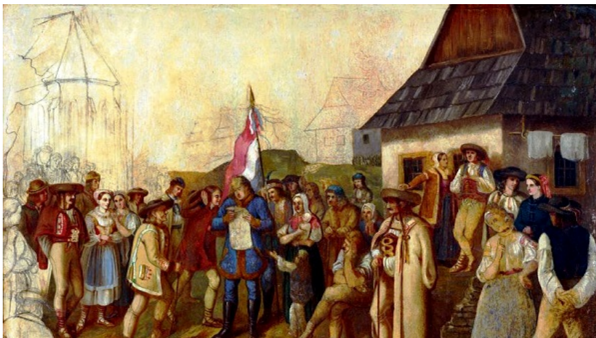
Zhromaždenie slovenského ľudu z jari 1848 od Petra Michala Bohúňa

Roku 1848, 10. 5. - v Liptovskom Mikuláši boli vyhlásené Žiadosti slovenského národa , najpokrokovejší slovenský politický program v 19. storočí. Maďarská vláda vyhlásila stanné právo a vydala zatykač na Štúra, Hodžu a Hurbana, ktorým sa však podarilo zachrániť útekem do Rakúska.