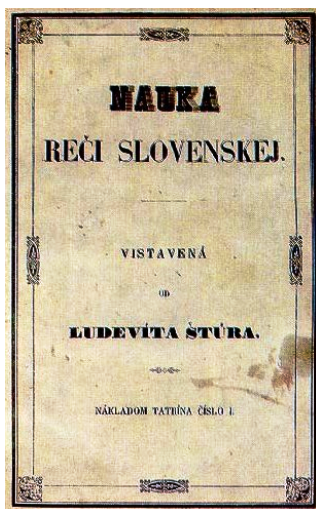
Nauka reči Slovenskej

Roku 1846 - Ľudovít Štúr publikoval literárne dielo Nauka reči Slovenskej (Náuka reči slovenskej) , ktorým položil základy spisovného jazyka po gramatickej stránke.