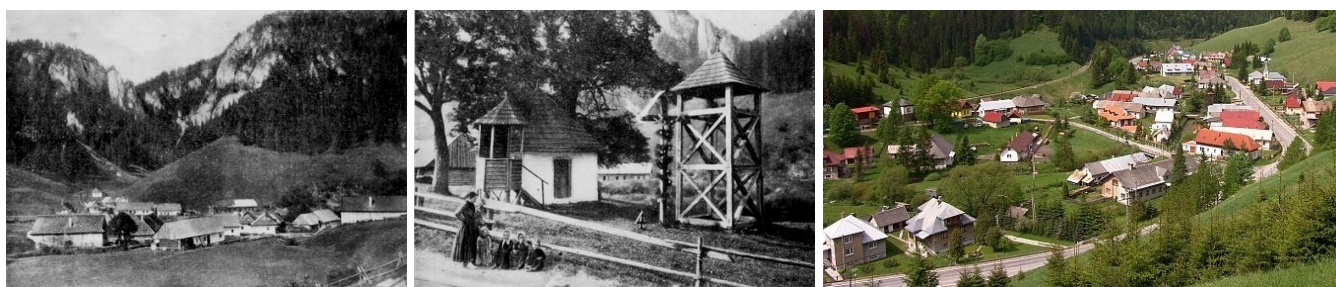
Obec Stratená v roku 1908 a dnes

- november - Andrej Hlinka, odvolanie ktorého súd odmietol, nastúpil do maďarskej väznice v Segedíne, v ktorej bol väznený až do februára 1910.