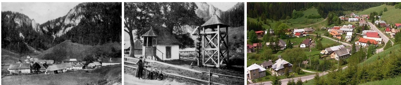
Obec Stratená v roku 1908 a dnes

- november - Andrej Hlinka, odvolanie ktorého súd odmietol, nastúpil do maďarskej väznice v Segedíne, v ktorej bol väznený až do februára 1910.