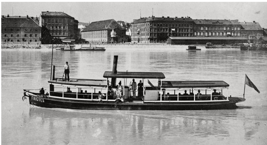
Fotografia z roku 1903 zachytáva pohľad na parníček Frigyes na Dunaji v Bratislave

Roku 1901 - začala politická aktivizácia Slovenskej národnej strany a bola obnovená účasť Slovákov vo voľbách.