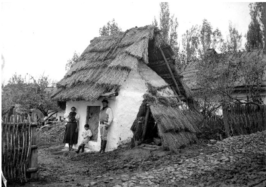
Obec Marhaň (okres Bardejov) v roku 1894