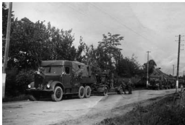
Povstalecká kolóna počas SNP