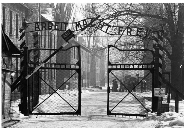
Koncentračný tábor Auschwitz (Osvienčim) – brána do pekla

Josef Mengele bol prvý, koho videli všetci, ktorí nedobrovoľne prišli do tohto tábora. Od ostatných esesákov sa v mnohom odlišoval. Jeho uniforma bola vždy dokonale vyžehlená, na rukách mu svietili biele rukavičky. Neodmysliteľnou súčasťou Mengeleho výbavy bola palička, ktorou ukazoval na prichádzajúcich: buď na ľavú stranu – do plynovej komory, alebo napravo – do tábora. Svoj pobyt v Auschwitzu chcel, ako sám hovoril, využiť na vedecké účely. Ako genetik a antropológ robil „výskum“, ktorý mal zdokonaľiť árijskú rasu tak, aby mali všetci jej príslušníci modré oči, svetlé vlasy a súmerné telá. On sám bol toho pravým opakom. Mal tmavé vlasy, tmavú pokožku a zelené oči, takže ho spolužiaci v škole prezývali Cigán. Mengele bol neuveriteľne neľútostný a bezcitný človek. Aj na príslušníka SS bol mimoriadne krutý a sadistický. Kým ostatní doktori SS sa počas selekcie museli vždy opiť, pretože za triezva to neboli schopní robiť, on a jeho blízky kolega Fritz Klein alkohol pri selekcii, kto má žiť a kto má okamžite zomrieť, nepotrebovali. Doktor Mengele si dokonca počas selekcie pohvizdoval árie od Pucciniho, Bacha, Verdiho, Straussa či Wagnera. Je o ňom tiež známe, že ako jediný bol ochotný stáť na prijímacej rampe v Auschwitzu aj v čase, keď mal mať službu niekto z jeho kolegov.