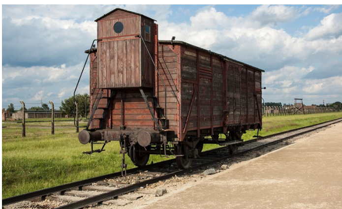
Po tejto trati väzňov iba privádzali, neodvážali nikoho

O jeho krutých rozhodnutiach kolujú legendy. O tom, s akou bezohľadnosťou vydával rozkazy, svedčí aj prípad z roku 1943. Keď vzniklo podozrenie, že sa v tábore objavil týfus, dal okamžite usmrtiť 1 300 Rómov