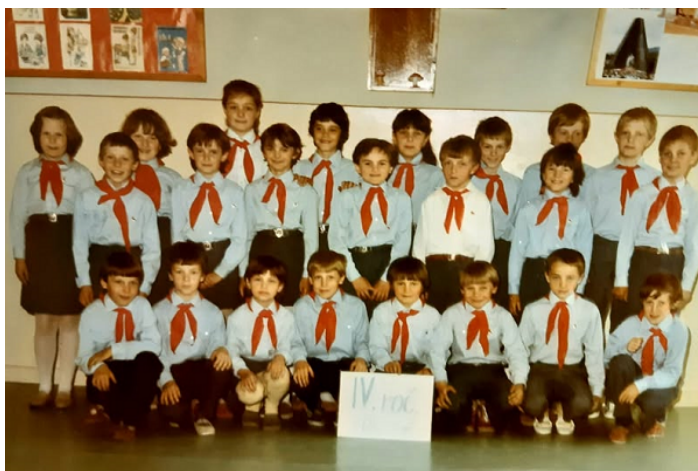
Pionieri z roku 1987