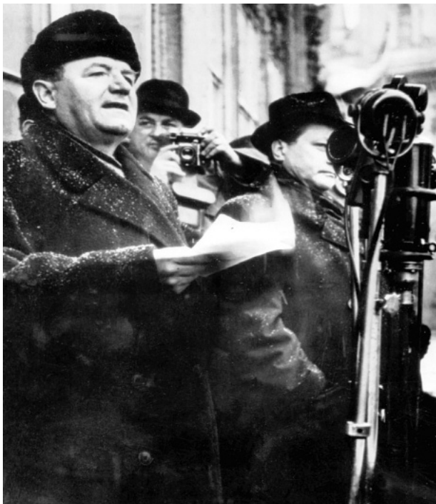
Dňa 25. februára 1948 sa na Václavskom námestí v Prahe konala manifestácia, na ktorej oznámil Klement Gottwald, že prezident Edvard Beneš prijal demisiu nekomunistických ministrov a schválil návrh novej vlády pod vedením Klementa Gottwalda

Nastalo obdobie komunistickej diktatúry.