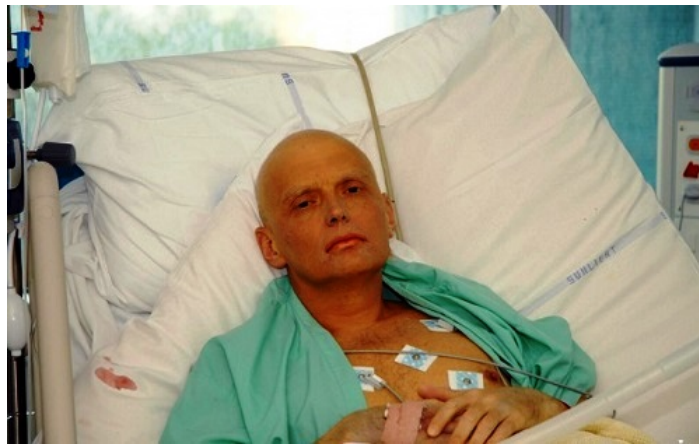
Litvinenko v londýnskej nemocnici

Roku 2006 - v londýnskej nemocnici zomrel na následky otravy bývalý ruský špión Alexander Litvinenko. Bývalý agent KGB a FSB obvinil pred smrťou zo zodpovednosti za atentát na svoju osobu ruskú tajnú službu.