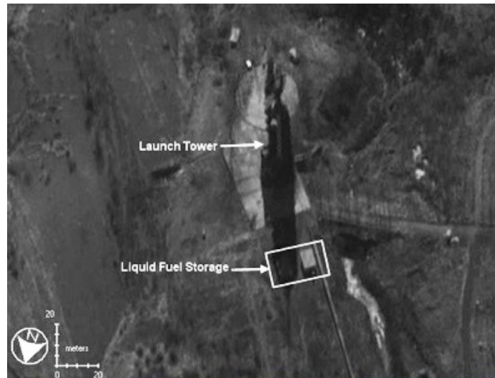
Lacrosse ešte na Zemi a záber z družice

Roku 1989 - vypustili USA prvú infračervenú družicu , t.j. družicu, ktorá vidí v noci.