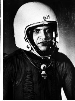
U-2 a Garry Powers