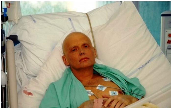
Litvinenko v londýnskej nemocnici

Roku 2006 - v londýnskej nemocnici zomrel na následky otravy bývalý ruský špión Alexander Litvinenko. Bývalý agent KGB a FSB obvinil pred smrťou zo zodpovednosti za atentát na svoju osobu ruskú tajnú službu.