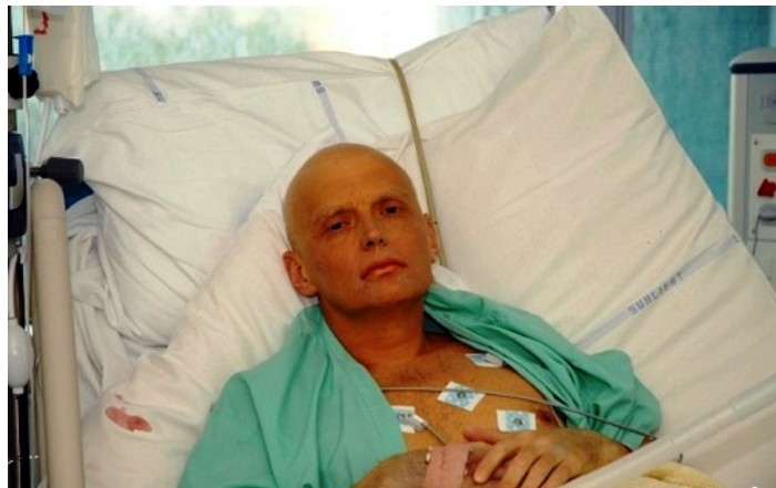
Litvinenko v londýnskej nemocnici

Roku 2006 - v londýnskej nemocnici zomrel na následky otravy bývalý ruský špión Alexander Litvinenko. Bývalý agent KGB a FSB obvinil pred smrťou zo zodpovednosti za atentát na svoju osobu ruskú tajnú službu.