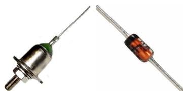
Fotografie Zenerovej diódy

Polovodičová dióda (dióda), zapojenie diódy v priepustnom a závernom smere, delenie podľa konštrukčno-technologického a funkčného hľadiska