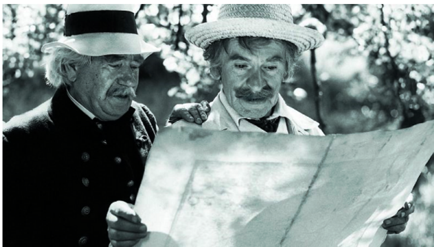
Samuel Adamčík a Jozef Króner vo filme Tisícročná včela

Jeho realistické herectvo so zmyslom pre charakteristický detail v úlohách čínorodých starcov často využívali film aj televízia ( Pole neorané , 1954; Drevená dedina , 1955; Jánošík 1962-1963; Živý bič , 1966; Rok na dedine , 1967; Hájkova žena , 1971; Sokoliarova dcéra , 1981; Tisícročná včela , 1983).