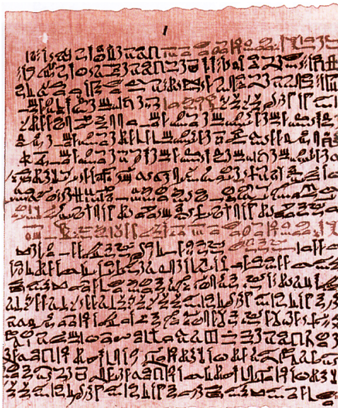
Časť z Eberovho papyrusu

Jeden z najstarších a najzachovalejších dokumentov aké poznáme, Eberov papyrus, zaznamenáva použitie kadidla a iných aromatických látok Egypťanmi na liečenie celého radu rôznych chorôb.