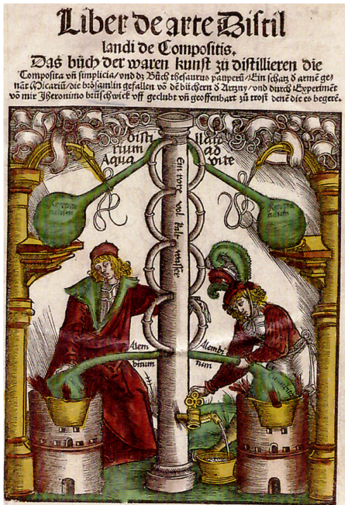
Tituná strana diela Liber de Arte Distillandi, od Brunschwiga (z roku 1512)