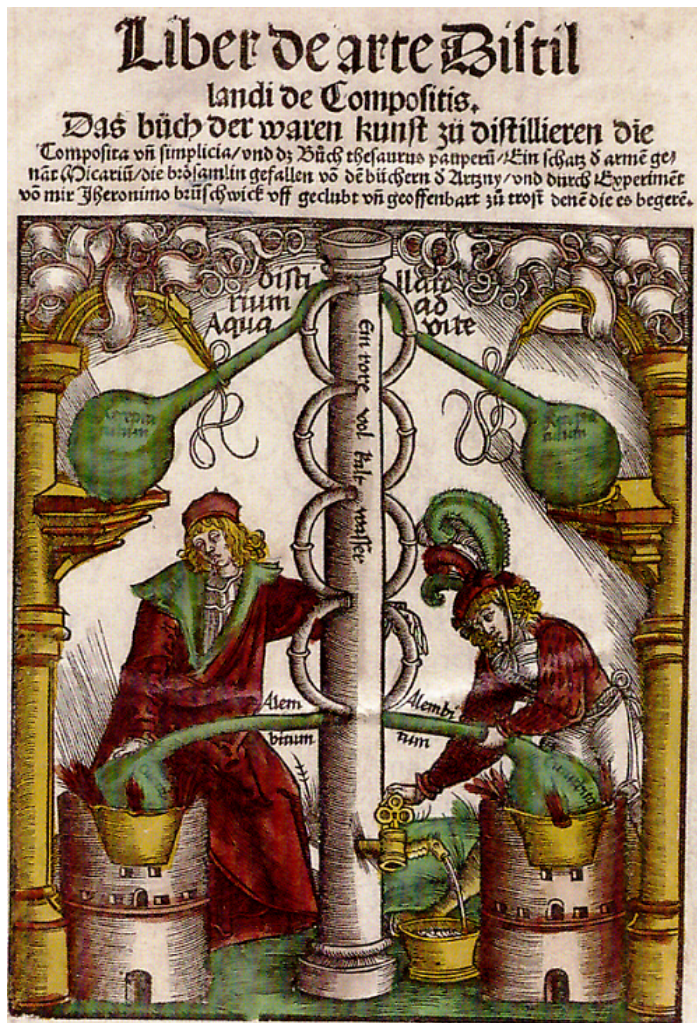
Tituná strana diela Liber de Arte Distillandi, od Brunschwiga (z roku 1512)