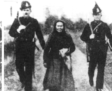
Perzekúcie uhorských žandárov