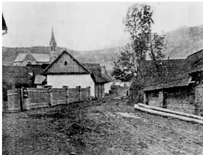
Černová na začiatku 20. storočia

Udalosti dodnes pripomína pamätník na cintoríne a na mieste tragédie pamätná tabuľa.