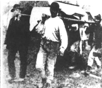
Pohreb obetí tragédie