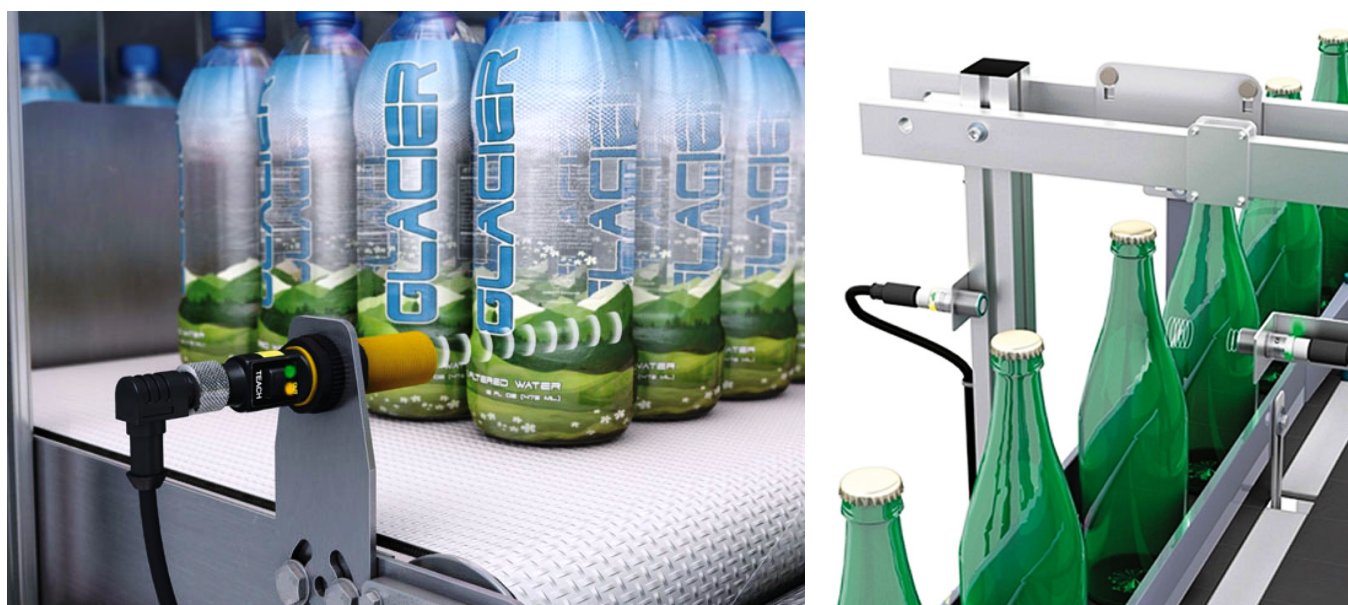
Využitie ultrazvukových senzorov na automatizovanom dopravnom páse

Ultrazvukové senzory sa objavili v priemysle pred viac ako tridsiatimi rokmi. Sú spoľahlivé a zároveň univerzálne. Ich použitie je bežné, obzvlášť pri detekcii dopravných pásov v automatizácii, ale aj inde. Ultrazvuk možno špecifikovať ako vlny akustických signálov, ktoré sú vo frekvenčnom pásme nad hranicou ľudského sluchu. Horná hranica ultrazvuku je v súčasnosti 1 GHz. Všeobecne platí, že zvuk pochádza z vibrácií hmoty, ktorá prenáša impulz do prostredia, väčšinou do ovzdušia. Táto hmota sa zhuťňuje alebo riedi vo vzduchu. Nazýva sa to rýchlosť šírenia zvuku c . Častice sa nepohybujú, vibrujú len okolo svojich rovnovážnych polôh. Základným predpokladom šírenia zvuku hmotou je jeho elasticita. Týmto spôsobom vytvárame zvukovú vlnu \lambda . Pri detekcii objektov pomocou ultrazvukových senzorov možno zaznamenať prakticky ľubovoľný materiál alebo predmet vo vzdialenosti niekoľkých desiatok metrov.