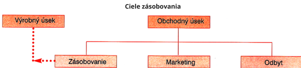
Miesto zásobovania v podniku

Zásobovanie patrí významné logistické činnosti. Zabezpečuje ho útvar zásobovania (nákupu) . Jeho hlavnými činnosťami ( zásobovacie činnosti ) sú: