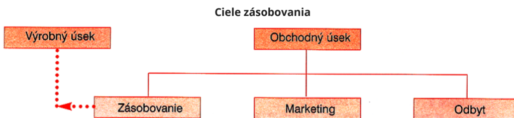
Miesto zásobovania v podniku

Zásobovanie patrí významné logistické činnosti. Zabezpečuje ho útvar zásobovania (nákupu) . Jeho hlavnými činnosťami ( zásobovacie činnosti ) sú: