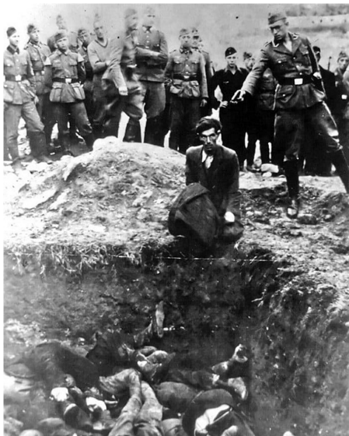
Poprava žida na Ukrajine