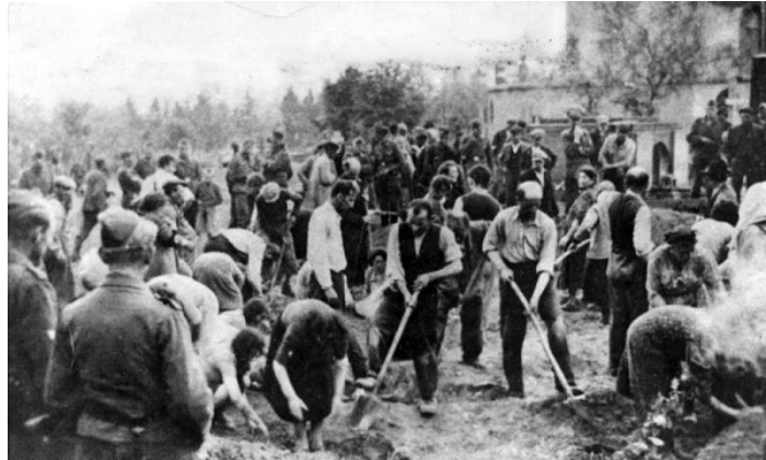
Židia kopajúci si vlastné hroby