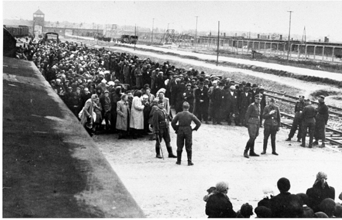
Deportovaní čakajú na selekciu