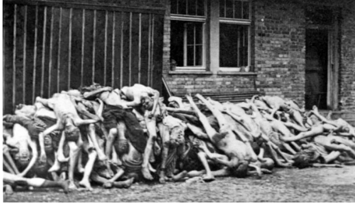
Ďalší z výsledkov holokaustu