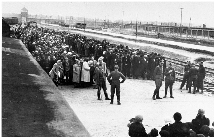
Deportovaní čakajú na selekciu