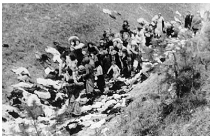
Pred popravou sa budúci zavraždení museli vyzliecť