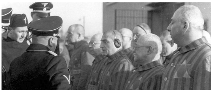
Židia v koncentračnom tábore