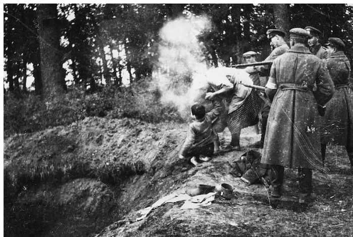
Poprava židovskej matky a jej dieťaťa