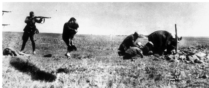
Vražda židovskej rodiny na Ukrajine