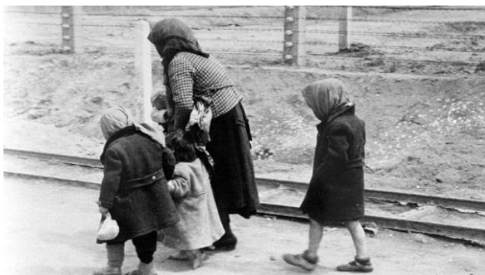
Židovská žena kráčajúca s deťmi k plynovej komore