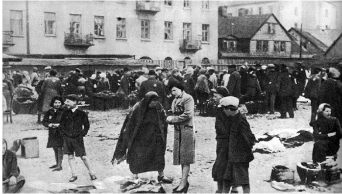
Geto v Lodži