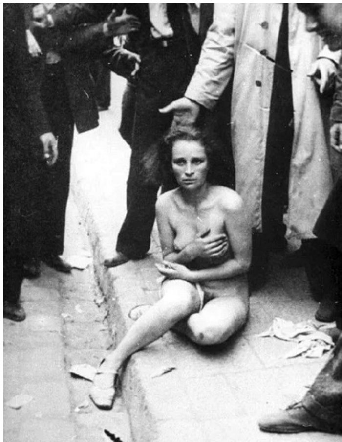
Židovský pogrom v L'vove