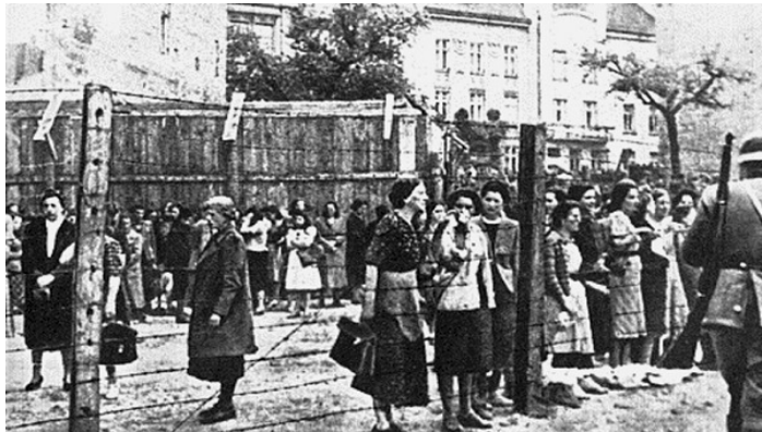
Geto v Lvove