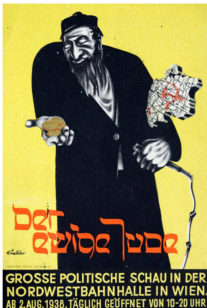
Reklama na antisemitskú výstavu vo Viedni z roku 1938