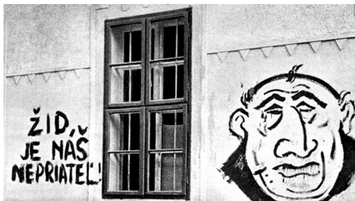
Nápis na stene domu z čias Slovenského štátu