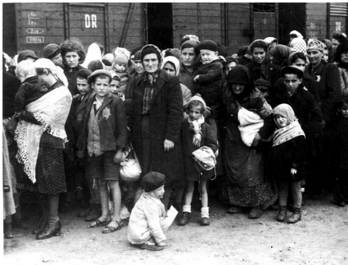
Odvážanie židov do koncentračných táborov