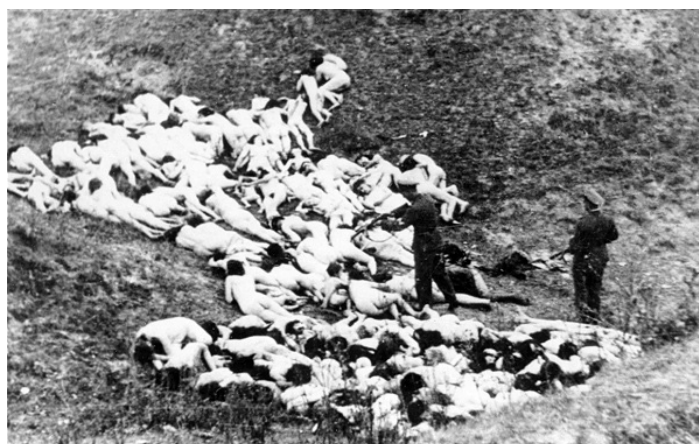
Vraždy židovských žien na Ukrajine