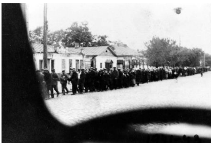
Židia idúci na popravu