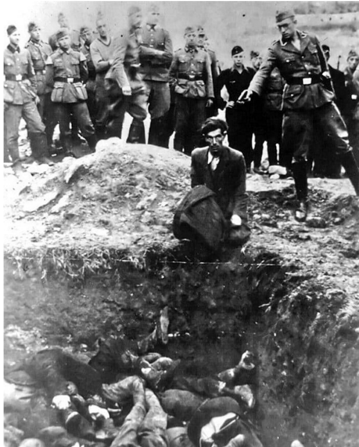
Poprava žida na Ukrajine