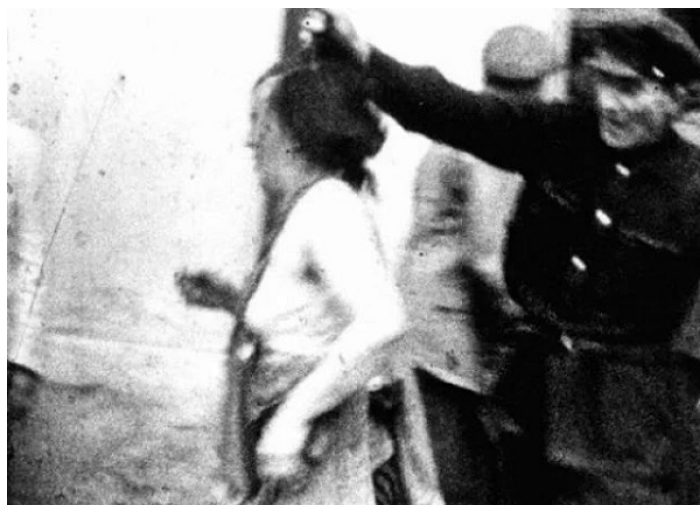
Židovský pogrom v L'vove