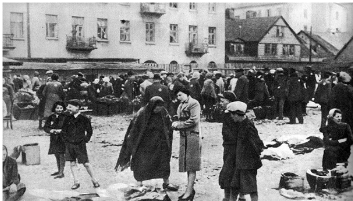
Geto v Lodži