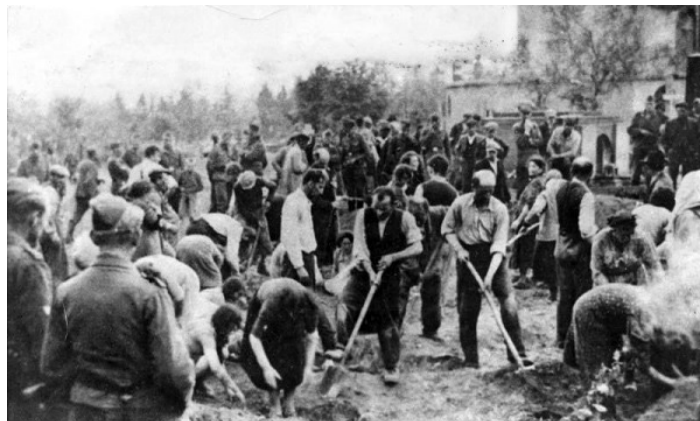
Židia kopajúci si vlastné hroby