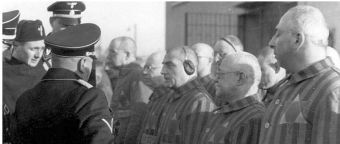
Židia v koncentračnom tábore