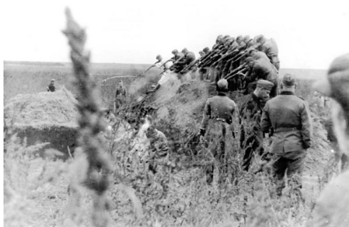
Vraždenie židov v Moldavsku v roku 1941