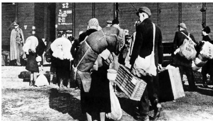
Nakladanie židov do vagónov. Fotografia je z popradskej stanice z marca 1942