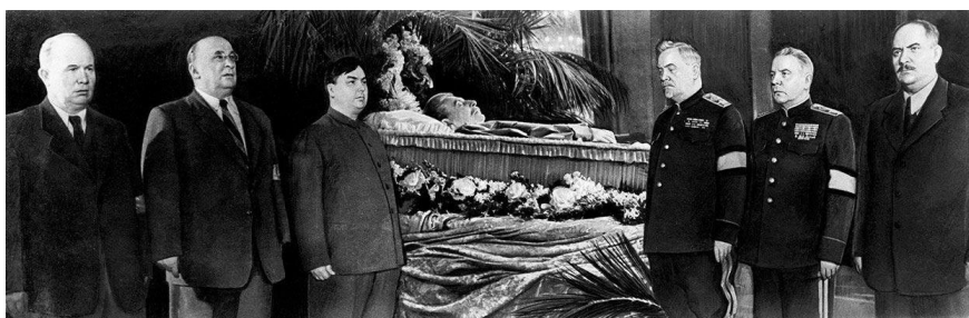
Berija pri Stalinovej rakve

Od 18. marca 1946 sa stal členom Politbyra najvyššieho výboru komunistickej strany, a tak sa dostal do úzkeho kruhu najvyšších predstaviteľov ZSSR. Kontroloval napríklad aj vývoj a testy prvej sovietskej atómovej bomby, ktorú ZSSR otestovali v roku 1949. Po Stalinovej smrti v roku 1953 bol Berija poverený Malenkovom vedením Ministerstva vnútra (MVD) a zároveň menovaný do funkcie podpredsedu vlády.