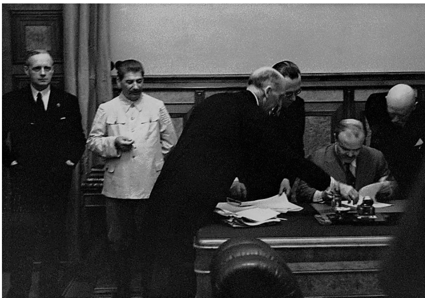
Podpis nemecko-ruského paktu o neútočení

Dňa 23. augusta 1939 ministri zahraničia Sovietskeho zväzu Vjačeslav Molotov a nacistického Nemecka Joachim von Ribbentrop podpísali dohodu o neútočení. V tajnom dodatku si rozdelili Poľsko a Sovietsi dostali voľnú ruku k okupácii Pobaltia a Moldavska [1] .