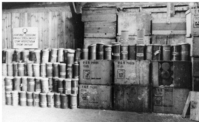
Cyklón B objavený v koncentračnom tábore Majdanek