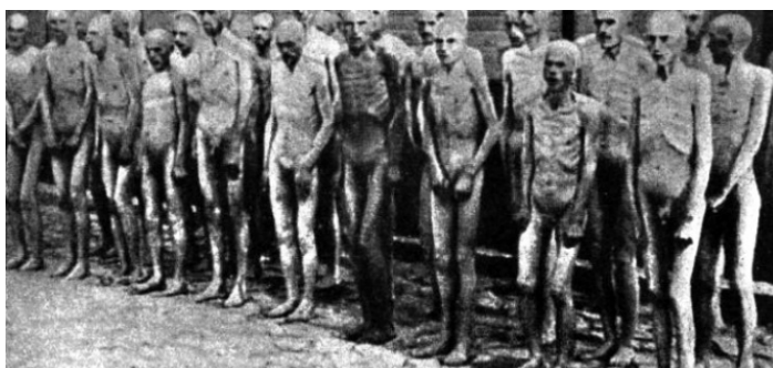
Väzni koncentračného tábora