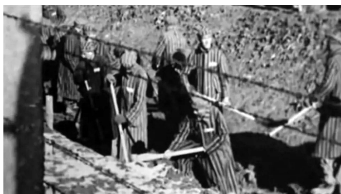
Väzni v Osvienčili "vdäka" ťažkej práci neprežili viac ako 4 mesiace