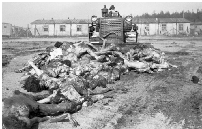
Britský buldozér zhŕňa v apríli 1945 mŕtvé telá do masového hrobu