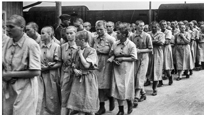
Ženy po selekcii