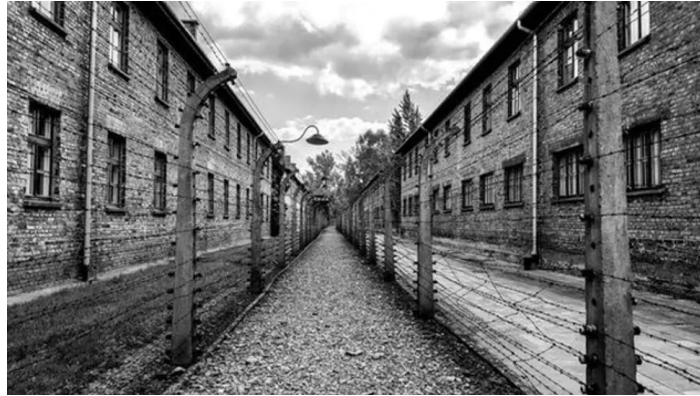
Plot koncentračného tábora Osvienčim

Po vojne boli mnohí z veliteľov týchto táborov súdení a potrestaní v rade procesov, ktoré prebiehali do 50. rokov. Iní však neboli postavení pred súd dodnes.