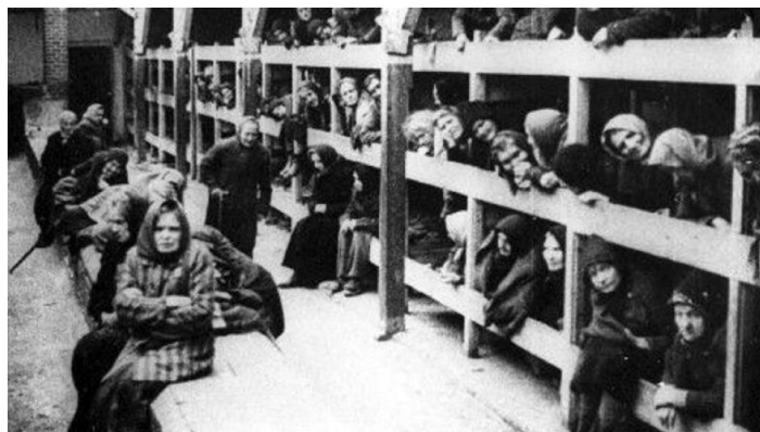
Ženy v koncentračnom tábore