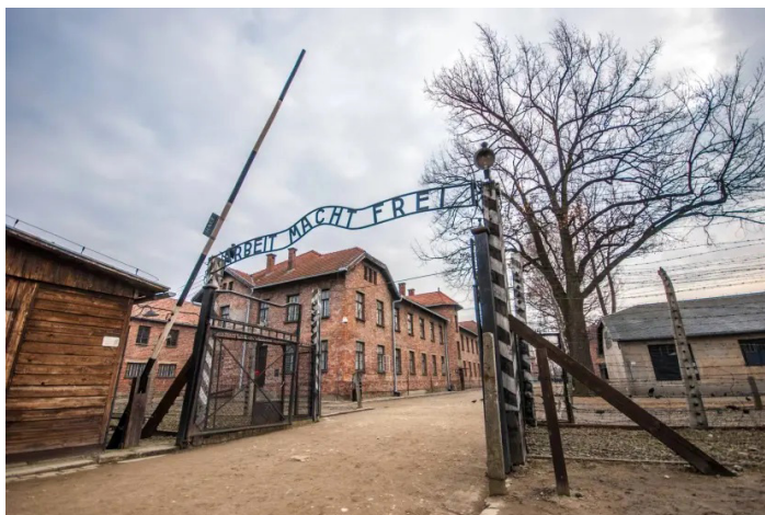
Vstupná brána koncentračného tábora Osvienčim, v ktorom zahynulo okolo 1,5 milióna ľudí

Po vypuknutí vojny vzrástol počet i veľkosť táborov a umiestňovali do nich celé armády novodobých otrokov určených na prácu alebo slúžili ako továrne smrti na vyhubenie európskej židovskej populácie - toto vyhladzovanie je dnes známe ako holokaust . Tábory spravovali nacistické elitné zbory SS a stali sa miestom najhoršieho mučenia, hrôz a masového vraždenia, aké svet doposiaľ poznal. Vo východnej Európe sa väzni využívali v pracovných jednotkách alebo pomáhali pri zabíjaní ostatných väzňov až do úplného vyhladenia. V táboroch, akým bol Osvienčim, sa na zabíjanie používali plynové komory, v ktorých zavraždili až 12000 osôb denne. Na západe boli smutne známe tábory Belsen, Dachau a Buchenwald. Podľa odhadov v táboroch zahynulo 6 miliónov židov, asi pol milióna Rómov a ďalších väzňov i niekoľko miliónov poľských a ruských vojnových zajatcov.