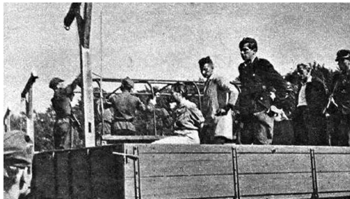
Príprava popravy dozorcov koncentračného tábora

Po vojne boli mnohí z veliteľov týchto táborov súdení a potrestaní v rade procesov, ktoré prebiehali do 50. rokov. Iní však neboli postavení pred súd dodnes.