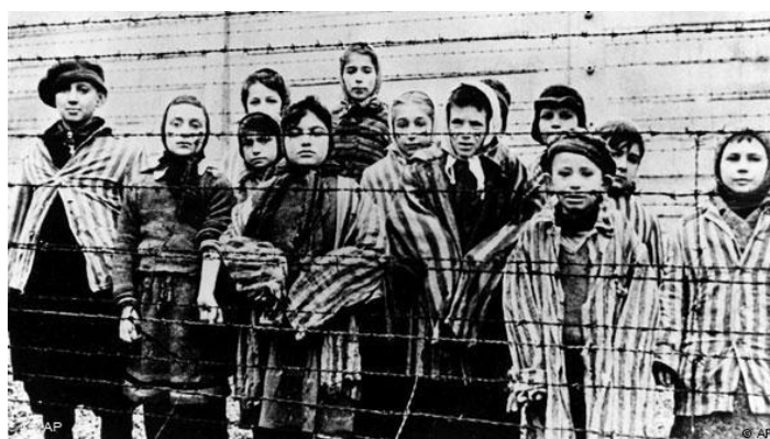
Deti v koncentračnom tábore