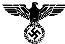
Zástava a logo NSDAP