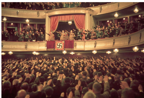
Hitler zachytený na zjazde NSDAP v Norimbergu

Pred vypuknutím Druhej svetovej vojny si niektoré prvky nacistickej politiky našli prívržencov aj v západných krajinách. V rokoch 1938-1945 nacisti vnútili svoj poriadok okupovanej Európe a v koncentračných táboroch uväznili a zavraždili milióny židov, Rusov, Poliakov, homosexuálov, Rómov, údajných podvratných politických živlov a ďalších ľudí.