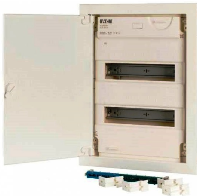
Obr. 2 Rozvodné skrine majú robustnejšiu konštrukciu než bytové rozvodnice

Rozvodná skriňa – na rozdiel od bytových rozvodníc bývajú rozvodné skrine odolnejšie voči mechanickému namáhaniu i voči prachu a vlhkosti. Elektrické rozvodné skrine nemusia obsahovať prepojovacie mostíky ani DIN lišty.