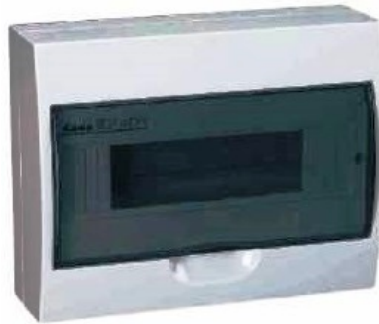
Obr. 1 Bytová rozvodnica nad omietku s dvierkami z dymového plastu

Rozvodná skriňa – na rozdiel od bytových rozvodníc bývajú rozvodné skrine odolnejšie voči mechanickému namáhaniu i voči prachu a vlhkosti. Elektrické rozvodné skrine nemusia obsahovať prepojovacie mostíky ani DIN lišty.