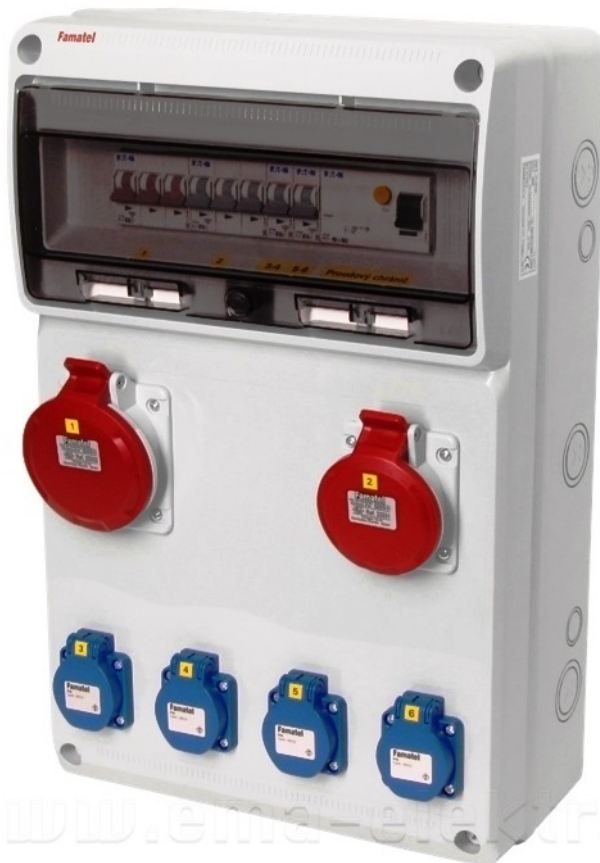
Obr. 5 Niektoré zásuvkové rozvodnice sú pripravené na osadenie ističmi či prúdovými chráničmi

Staveniskový rozvádzač – je určený na napájanie dočasných rozvodov elektrickej energie na stavenisku, pri stavebných, rekonštrukčných či búracích prácach. Na staveniskové rozvádzače sú kladené zvýšené požiadavky, venuje sa im osobitná STN. Od iných sa líšia zabudovaným stojanom, vyššou odolnosťou voči vlhkosti, napájaním pomocou 400 V zástrčky, hlavným vypínačom... Stavebný rozvádzač si bežne môžete nechať vyrobiť alebo si ho môžete požičať.