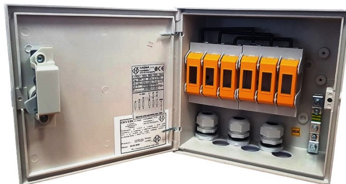
Obr. 4 Poistkové skrinky slúžia najmä na realizáciu elektrických prípojok zo vzdušného vedenia na stĺpoch

Poistková skrinka – je vybavená poistkovými držiakmi a svorkou na pripojenie PEN vodiča. Poistná skrinka je spravidla určená na realizáciu elektrickej prípojky vzdušného vedenia na elektrickom stĺpe.