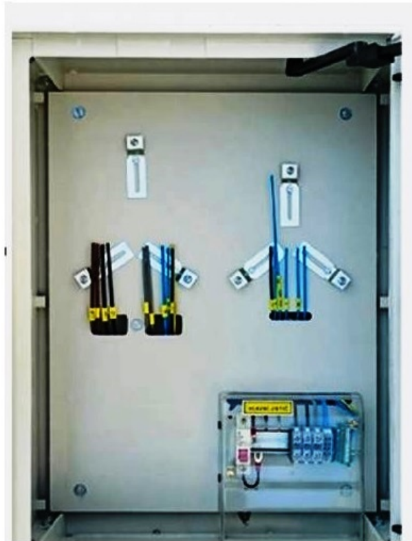
Obr. 3 Elektromerové rozvádzače sú pripravené na osadenie elektromera a hlavného ističa

Poistková skrinka – je vybavená poistkovými držiakmi a svorkou na pripojenie PEN vodiča. Poistná skrinka je spravidla určená na realizáciu elektrickej prípojky vzdušného vedenia na elektrickom stĺpe.