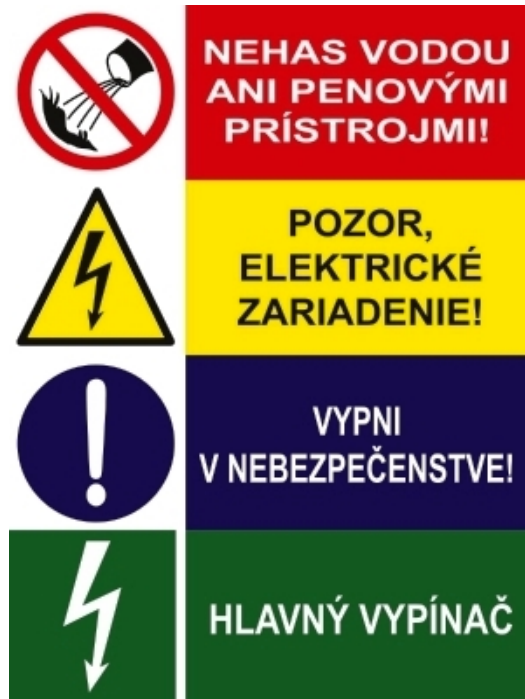
Obr. 6 Na rozvádzačoch nesmú chýbať bezpečnostné označenia

Prístroje v rozvádzači musia byť prehľadne a prístupne usporiadané. Musia byť označené trvanlivo a v súlade so schémami zapojenia, t.j. jednotlivé obvody a prístroje sa musia dať identifikovať. Schémy musia byť dodané spolu s rozvádzačom. Častou chybou bývajú aj chýbajúce záslepky na voľných modulových pozíciách. V tom prípade elektrický rozvádzač nespĺňa požiadavky na krytie IP.