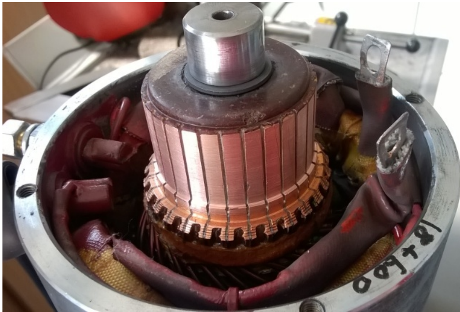
Obr. 51 Komutátor jednosmerného motora. Konštrukčne je takmer zhodný so striedavým

Obr. 50 Vysunutý uhlík (kefa) z držiaka. Pružina je zaistená v hornej polohe, inak tlačí na uhlík a vytvára tak prítlak na komutátor