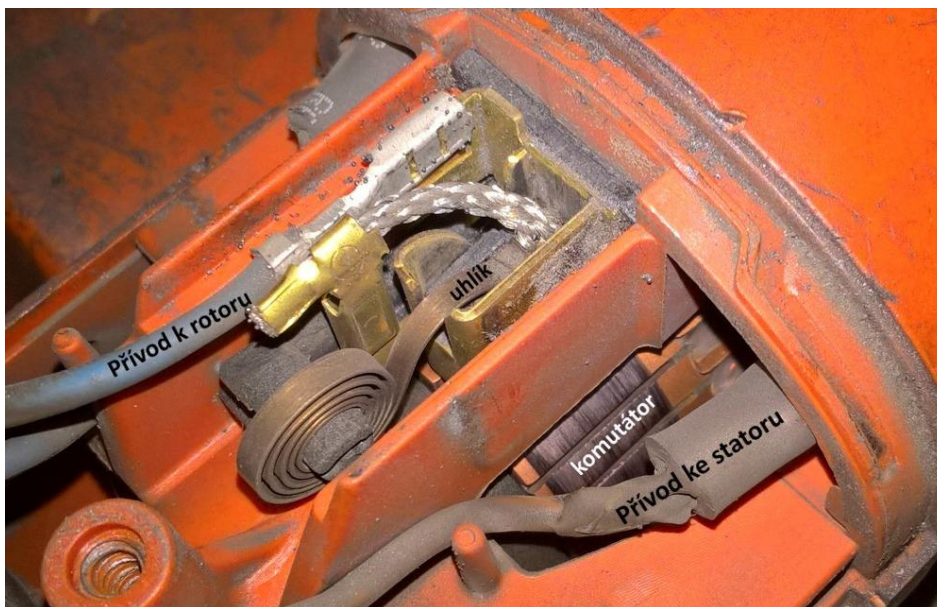
Obr. 49 Detail pripojenia motora. Na obrázku možno vidieť prívody na sator a rotor, komutátor a uhlík

Tieto motory sa používajú v dopravných strojoch, v elektrickej trakcii a najmä vo väčšine ručného náradia a spotrebičoch (vrtáčky, brúsky, vysávače a podobne).