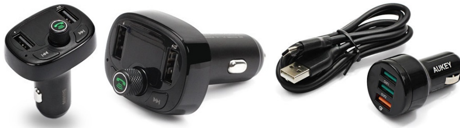
Nabíjačky do auta

Obyčajná sieťová nabíjačka v niektorých chvíľach nie je postačujúca. Najmä nie pre ľudí, ktorí trávajú väčšinu času na cestách. Za týmto účelom boli vytvorené autonabíjačky, ktoré zapájame do zásuvky zapaľovača cigariet v automobiloch. Nabíjačky moderných automobilov fungujú rovnako efektívne a niekedy môžu dokonca nabíjať ešte rýchlejšie. Sú dostupné aj v type Quick Charge, ktorý výrazne urýchľuje nabíjanie.