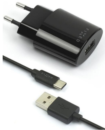
Sieťová nabíjačka s odnímateľným USB-C káblom