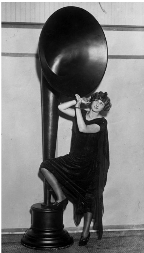
Reproduktor v roku 1929