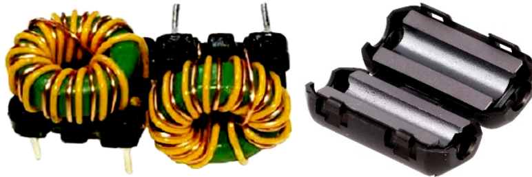
Toroidná cievka s feritovým jadrom