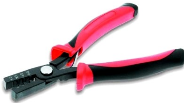
Lisovacie kliešte na dutinky

Dutinky by ste mali používať vždy pri spojení lankového vodiča a skrútkovej svorky. Lisujú sa špeciálnymi kliešťami.