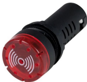
Bzučiak s červeným podsvietením