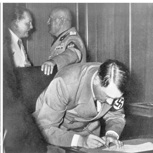
Adolf Hitler pri podpise Mníchovskej zmluvy