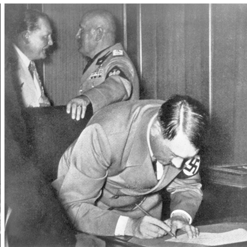
Adolf Hitler pri podpise Mníchovskej zmluvy