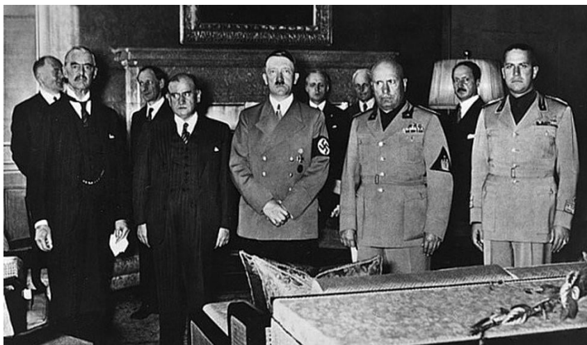
Chamberlain, Daladier, Hitler, Mussolini a Ciano odfotení pred podpísaním Mníchovskej dohody