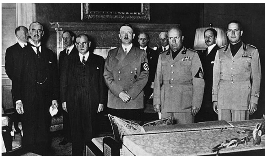
Chamberlain, Daladier, Hitler, Mussolini a Ciano odfotení pred podpísaním Mníchovskej dohody