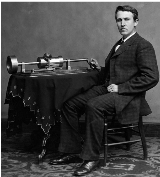
Edison a jeho fonograf

Princípom fonografu je mechanický záznam kmitov zvukom rozochvenej membrány umiestnenej na konci lievika. Membrána je spojená s rycím hrotom, ktorý do rotujúceho záznamového média v tvare valčeka vyrýva zvukovú stopu s premenlivou hĺbkou v tvare pružiny. Najčastejšie používaným záznamovým materiálom bola vosková hmota, pôvodne sa používal staniol (hliníková fólia). Takto zaznamenaný zvuk bolo možné opakovane prehrávať tak, že sa ihla vrátila na začiatok takto vyhlbenej drážky. Fonograf preto tvorili dve jednotky, jedna pre záznam, druhá pre prehrávanie.